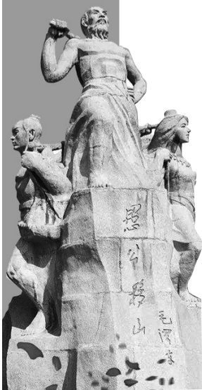
济源愚公移山雕像