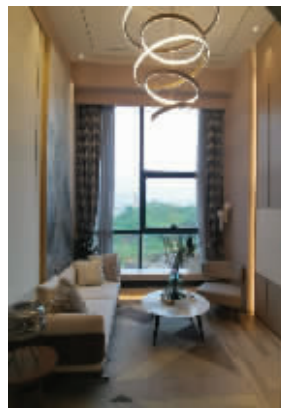
高铁东广场正商国际大厦样板间实景图

在正商寓见铭筑、美誉铭筑、滨河铭筑、书香铭筑、启航国际广场、林溪铭筑等成品公寓项目中，钢木复合门+指纹、密码、钥匙三合一智能锁均是入户标配，木饰电视背景墙、户内单体空调、新风系统安装到位，入户门的便携式挂钩和开门自动亮起的小夜灯，更让业主感觉到贴心和温馨。