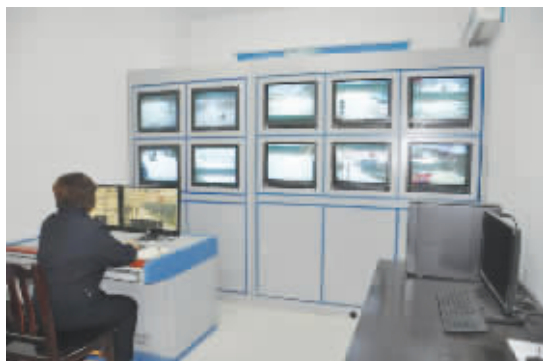
甘岸视频监控中心