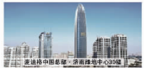
麦迪格中国总部·济南绿地中心30楼

麦迪格矫正组合在近视眼矫正方面，通过科学的方法矫正近视眼。麦迪格矫正组合在近视眼矫正方面，通过科学的方法矫正近视眼。