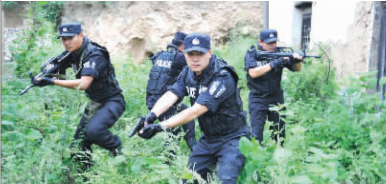
特警实兵实战拉动演练