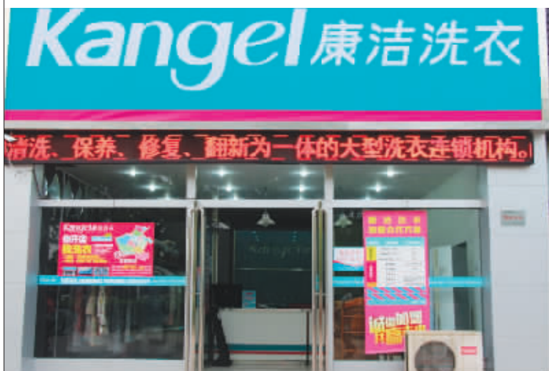
只要30平方的面积,就可以开一家康洁连锁店

▶ 风衣、皮衣脏了怎么办? 洗衣店自然是清洗这些又贵又厚重的衣服的首选场所。但是传统洗衣店固定的开门时间、送取的长时间等待一直被不少年轻上班族所诟病。